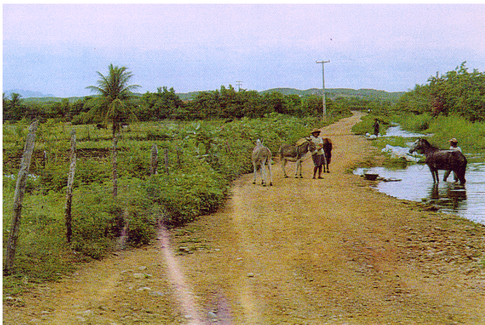
Figura 1.4.6.1 Canal principal que atende parcialmente a Bacia Hidráulica do Lima Campos

Os terrenos das vazantes são planos de maneira que o abaixamento das águas do açude resulta no descobrimento de vastas áreas úmidas propícias para aproveitamento agrícola.(Figura 1.4.6.1)