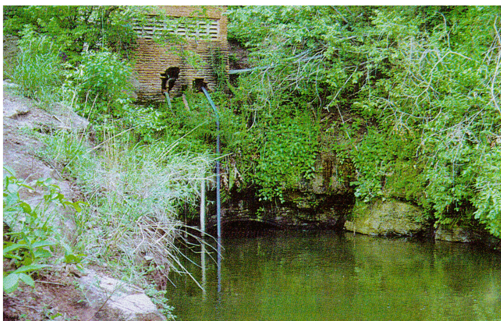
Figura 1.4.6.2 Trecho central do túnel de ligação entre os açude Orós e Lima Campos (trecho atravessando uma serra).

O açude Orós foi construído pelo DNOCS no período de 1958 a 1962 motivado pela severa seca de 1958. O Projeto do Orós incluiu a construção de um túnel - canal, calado à cota 189, para alimentação do açude Lima Campos e, através dessa, permitir a irrigação das várzeas da Planície do Icó. (Figura 1.4.6.2). Vale salientar que esta ligação era um projeto antigo com um trecho em canal e o túnel concluídos no início da década de 30.